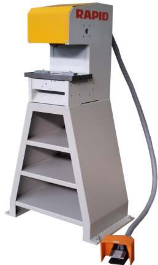
Abbildung rechts: Stanzmaschine mit Werkzeug-Schnellwechsellvorrichtung.

Abbildung links: Stanzmaschine mit Revolverteller zur Aufnahme von 6 Werkzeugen: ST 100 R mit 100 kN Kolbenkraft ST 120 R mit 120 kN Kolbenkraft Einsatz: bei Profilen mit großen Wandstärken oder großen Abmessungen.