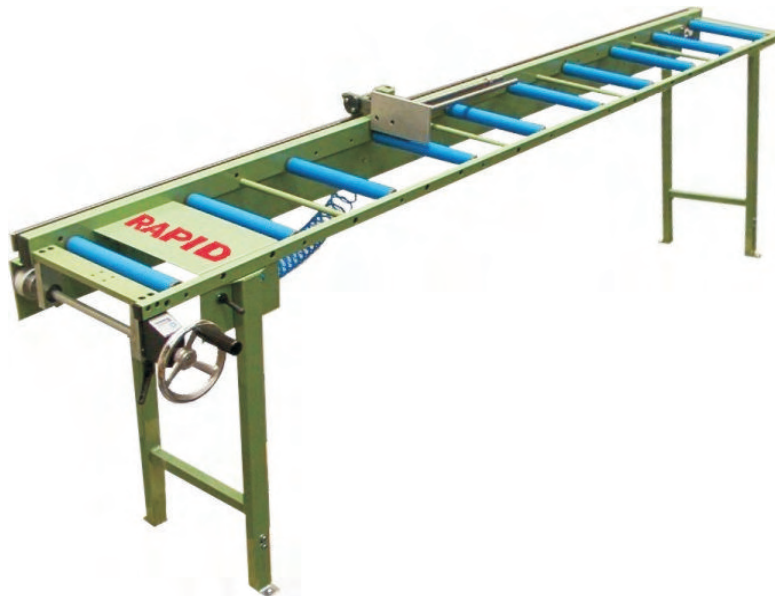
Abbildung 2 Digitaler Längenanschlag RM-DI

mit nach hinten wegklappbarem Materialanschlag, Anschlagschieber über Handrad vom Arbeitsplatz aus verstellbar, elektronische digitale Maßanzeige, pneumatische Verriegelung