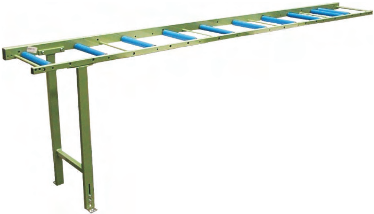
Abbildung 1 Rollenbahnen R