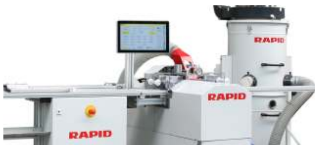
Abb./fig.: GLX250 mit Längenanschlag RLA GLX250 with the length stop RLA

This method ensures a clean look of the window corners. The profile depending parts are usually universal within a profile system since they are only adapted to the respective holding foot.