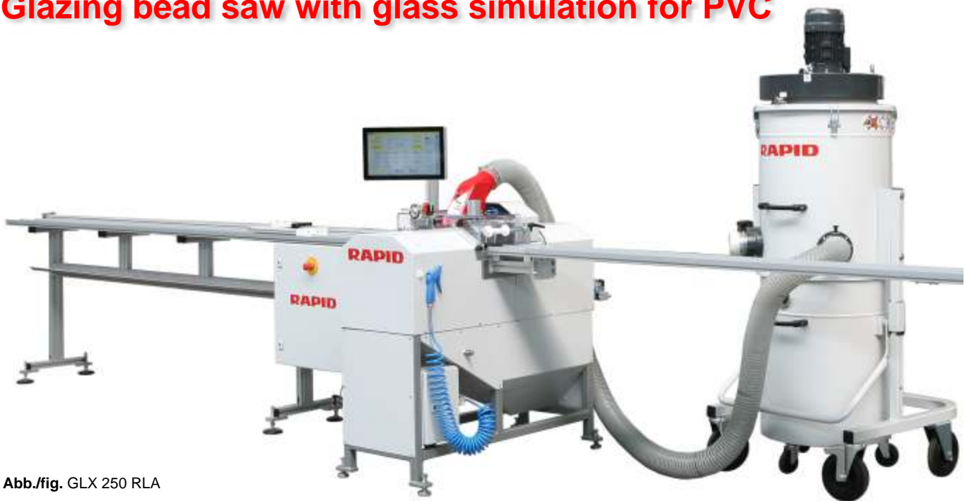
Abb./fig. GLX 250 RLA