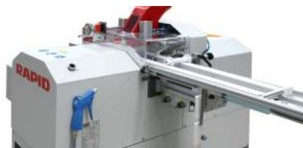
Abb./fig.: GLX250 mit manuellem Messsystem GLX250 with manual measuring system